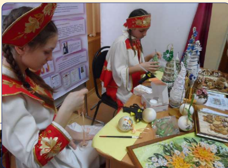
Региональный фестиваль «Созвездие талантов – 2016»