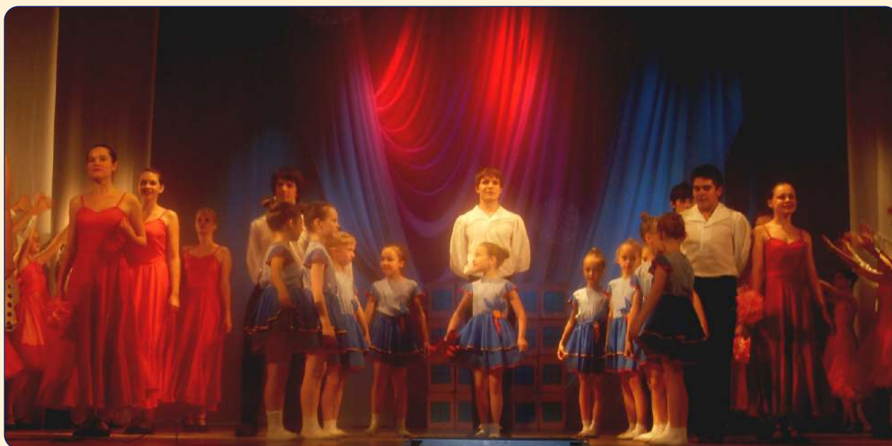
Региональный гала-концерт «Созвездие талантов», 2017 год

Подготовка к юбилейной дате может стать открытой площадкой для представления родительской аудитории спектра образовательных услуг, реализуемых дополнительным образованием, а также творческих, интеллектуальных и спортивных достижений детей.