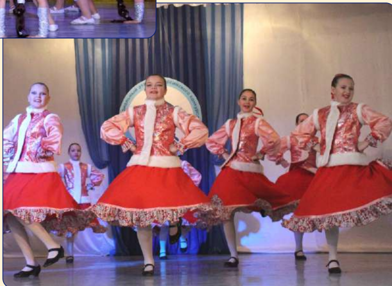
Региональный фестиваль «Созвездие талантов – 2015»