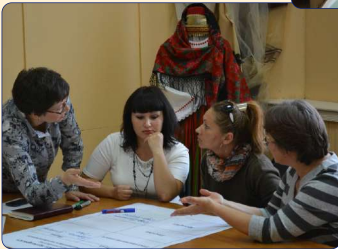
Заседание родительского актива по вопросам открытия выставки детского творчества

Привлечение родителей к разноплановой деятельности образовательных организаций в сфере интеллектуального, спортивного и творческого развития детей