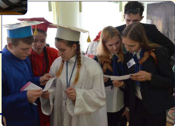
Диалоговая площадка активистов научного общества учащихся

Популяризация достижений детей в творческих, интеллектуальных и спортивных видах деятельности