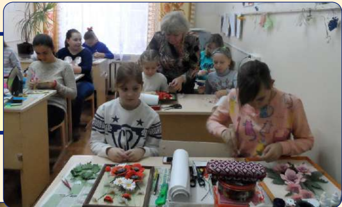
Творческие занятия с детьми