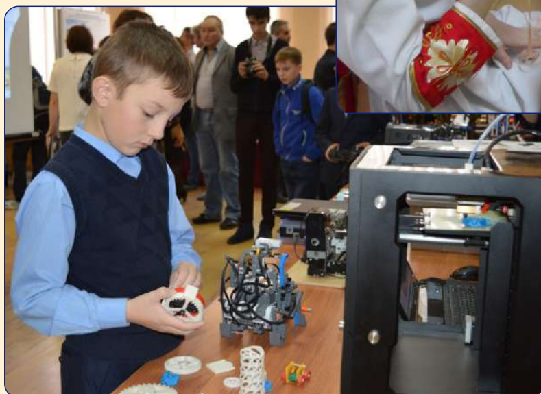
Региональный фестиваль «Созвездие талантов – 2014»

Завершающим является региональный этап Фестиваля, в котором принимают участие дети, ставшие призерами муниципального этапа.