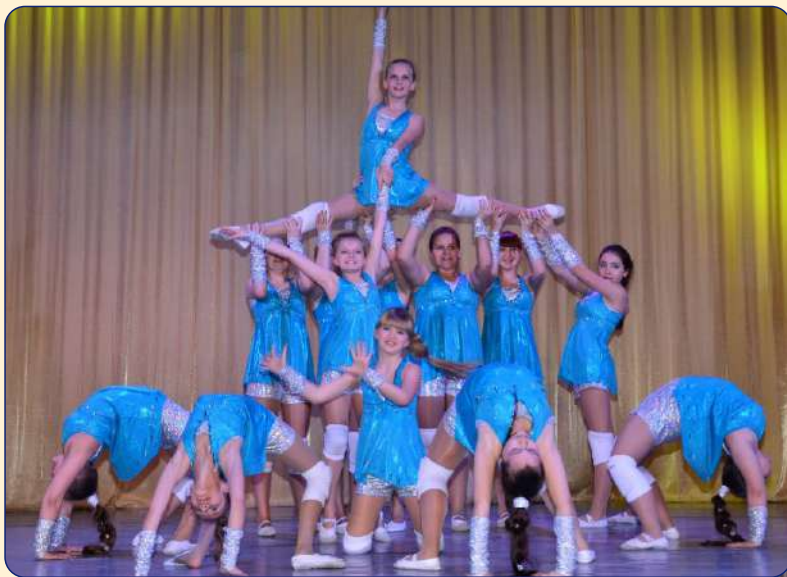
Региональный фестиваль «Созвездие талантов – 2014»

Итоговым мероприятием каждого этапа проекта станет Фестиваль детского творчества по всем направлениям дополнительного образования.